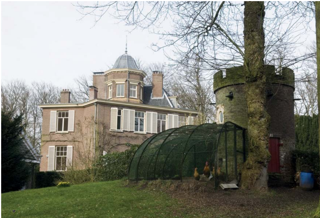
Het landgoed Jagtlust heeft een prachtige duiventoren die u tijdens de Open Monumentendag kunt bezichtigen.