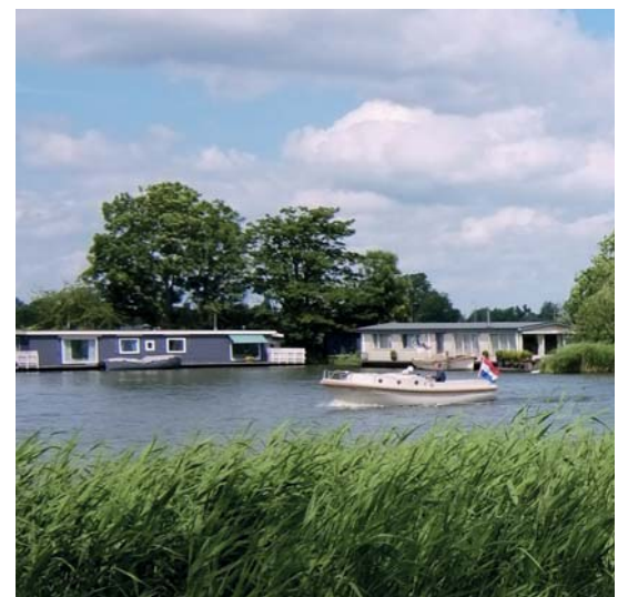
De gemeente waarschuwt woonarkbewoners voor illegale erfpachtconstructies.

Soms worden er erfpachtconstructies aangeboden die publiekrechtelijk niet mogelijk zijn. Een voorbeeld hiervan is de eeuwigdurende erfpachtconstructie: men koopt de erfpacht dan in één keer voor een fors bedrag af. Hierdoor wordt eigenlijk het water verkocht waarop de woonark is afgemeerd en is er geen sprake meer van bedrijfsmatige exploitatie. De gemeente adviseert potentiële woonarkbewoners of woonarkeigenaren die naar een andere ligplaats willen verhuizen eerst informatie op te vragen bij het Plassenschap of de gemeente.