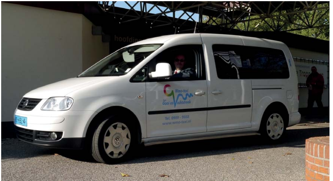
De Wmo-taxi is bedoeld voor mensen die moeilijk op eigen gelegenheid de deur uit kunnen en niet in staat zijn om met het openbaar vervoer te gaan.

Om in aanmerking te komen voor de Wmo-taxipas, heeft u een indicatie nodig die door een consulent van het loket Zorg, Werk & Inkomen wordt vastgesteld. Het loket Zorg, Werk & Inkomen is op werkdagen van 08.30 tot 12.30 uur bereikbaar via telefoonnummer: 14 035