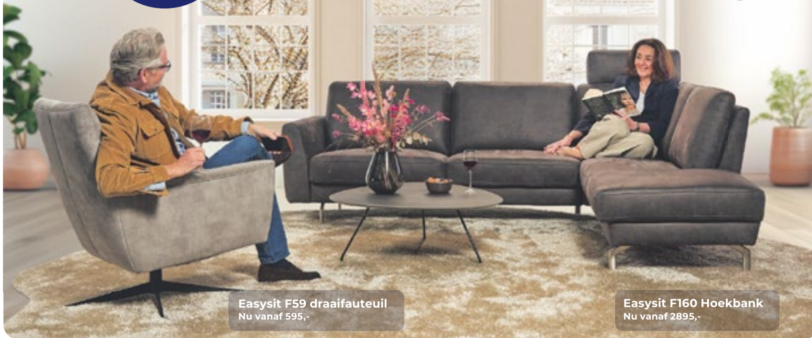
Easysit F59 draifauteuil Nu vanaf 595,-