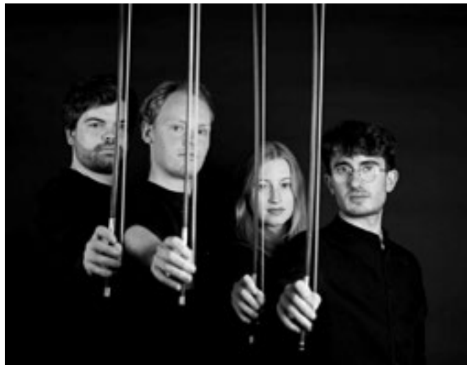
Het Jagthuis, Middenweg 88, Nederhorst den Berg (Horstermeer).

Concert Fibonacci Kwartet: zondag 23 februari, aanvang 15.30 uur, entree 22 euro (tot 25 jaar 10 euro). Reserveren via de website www.jagthuis.nl , per email via stal@jagthuis.nl of telefonisch 0294-252609. De locatie van het concert is