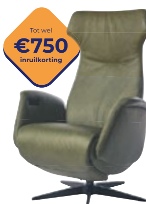
Easysit D02 Comfort, stijl in in één fauteuil. Nu vanaf 2395,-