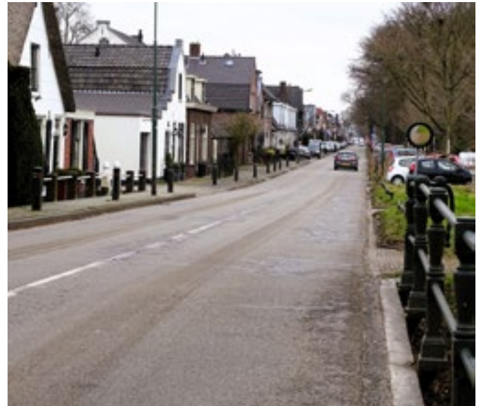
Foto: Zuidereinde-Noord vanaf de Syllisburgbrug bij Trompenburg

Het college van burgemeester en wethouders heeft besloten om de herinrichting Zuidereinde-Noord stop te zetten. "Wij zijn ervan overtuigd dat we dit project in de huidige vorm niet succesvol en duurzaam kunnen realiseren, met voldoende draagvlak. Deze opgave heeft meer tijd en een beter ingerichte participatie nodig. Dat is echter niet haalbaar binnen de huidige planning."