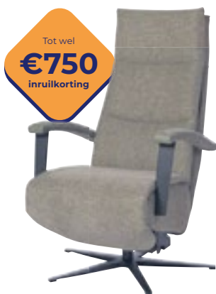
Easysit F30 Comfort dat zich aan jou aanpast. Nu vanaf 1895,-

Je zit dezelfde dag op je nieuwe stoel of bank