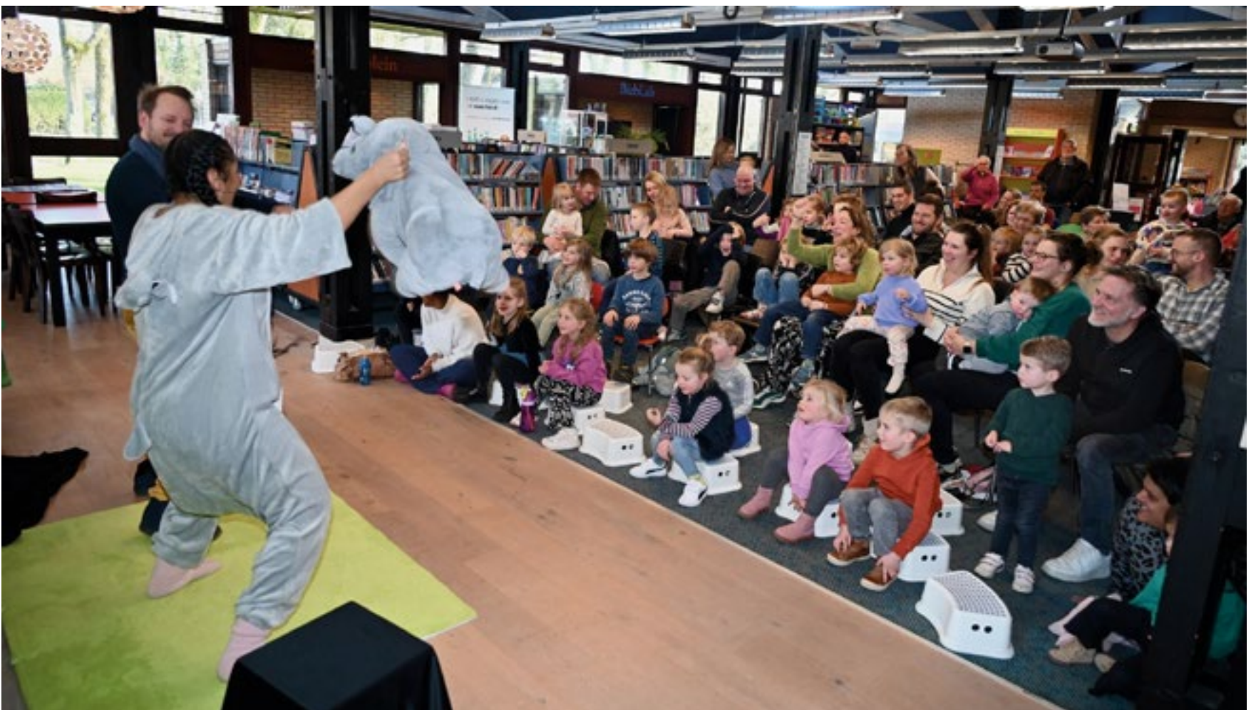
In de Loosdrechtse Bibliotheek is van alles te doen; hier tjokvol met kinderen bij de theatervoorstelling Rinus tijdens de Nationale Voorleesdagen, maar de komende week weer BiebLab, Energieloket, Taalmaatjes, Themacafé etc..