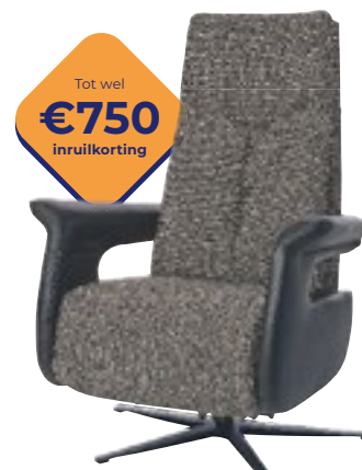
Easysit F40 Dit is past echt ontspannen zitten. Nu vanaf 1745,-

Alle stoelen zijn leverbaar met elektrisch verstelbare rug en voetensteun. In verschillende maten, kleuren, bekleding en opties.