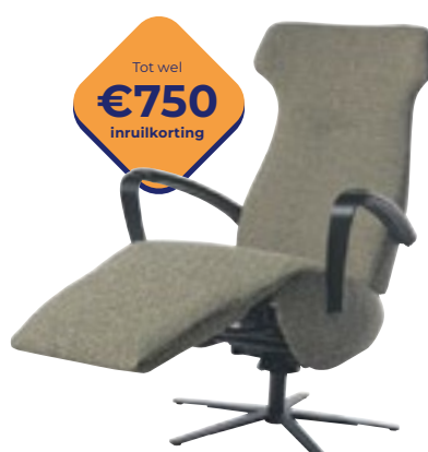
Easysit D01 Prachtig design en gebruiksgemak. Nu vanaf 2395,-