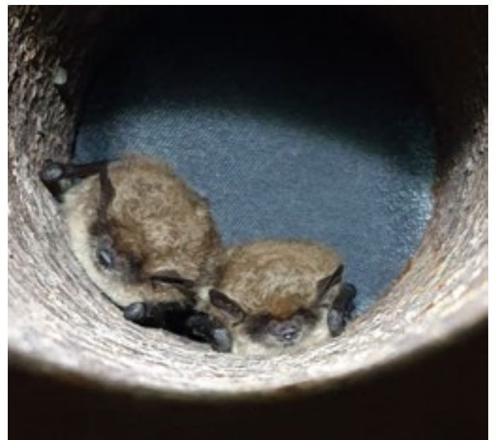
Foto: Twee baardvleermuizen op Fort Kijkuit – 2025

de opslagplek voor kanonnen en munitie. Op de plek waar ooit de trap naar de kruittelkelder heeft gezeten, zit nu een groot gapend gat. Lopen door de stikdonkere remise is niet zonder risico, Dat blijkt wel uit het skelet van een vos, dat onder aan het gat ligt. Met de ladder gaan we voorzichtig naar beneden de kelder in. En met zaklampen worden op systematische volgorde de verschillende ruimtes in de kelder afgespeurd. Het resultaat valt tegen. Meer geluk hebben we in het wachthuis: de plek waar de speciale weggkruipstenen hangen. Ook dit jaar weten verschillende watervleermuizen, baardvleermuizen en gewone grootvleermuizen de stenen te vinden. Dat constateren we, terwijl we op de grond liggend met verrekijker en zaklamp in de stenen turen. En dan vindt Annemieke een vleermuis op een plek, waar de boommarter makkelijk bij zou kunnen komen. En nog één en nog één. We kunnen eigenlijk niet anders concluderen dan dat de boommarter het forteiland heeft verlaten of is overleden. Beetje triest, maar goed nieuws voor de vogels (hij eet ook eieren) en uiteraard de vleermuizen. En wie weet trekt een martervrij wachthuis volgend jaar nóg meer overwinterende vleermuizen!