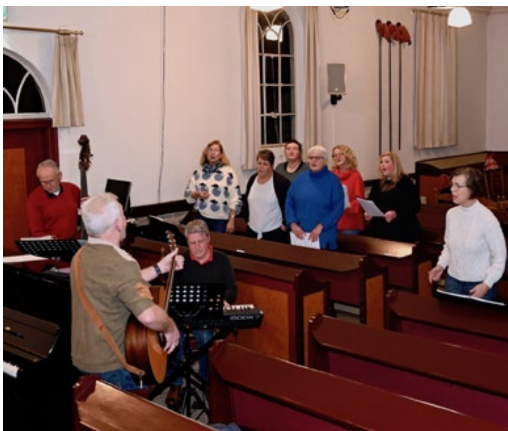
Praise Loosdrecht zingt al 25 jaar! Repetitie voor het feestelijk concert 1 februari in de Sijpekerk in Loosdrecht.