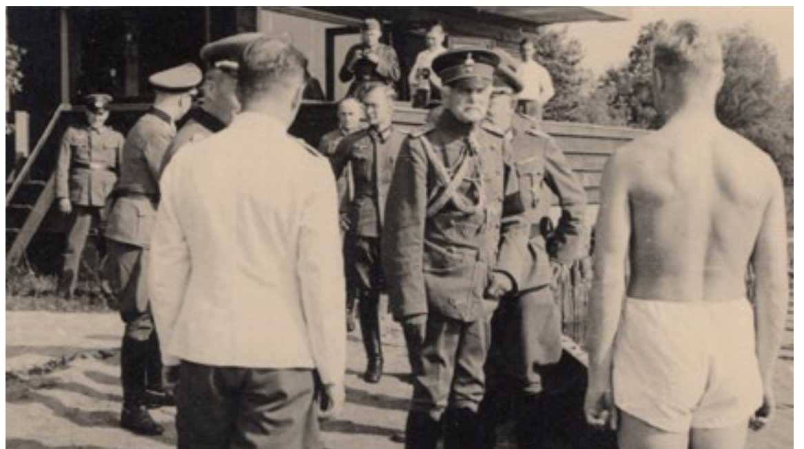
Aankomst August von Mackensen in Loosdrecht; Duitse soldaten ontspannen op en aan het water, juni 1941.

Voor deze vorderingen krijgen de Loosdrechtse ei-