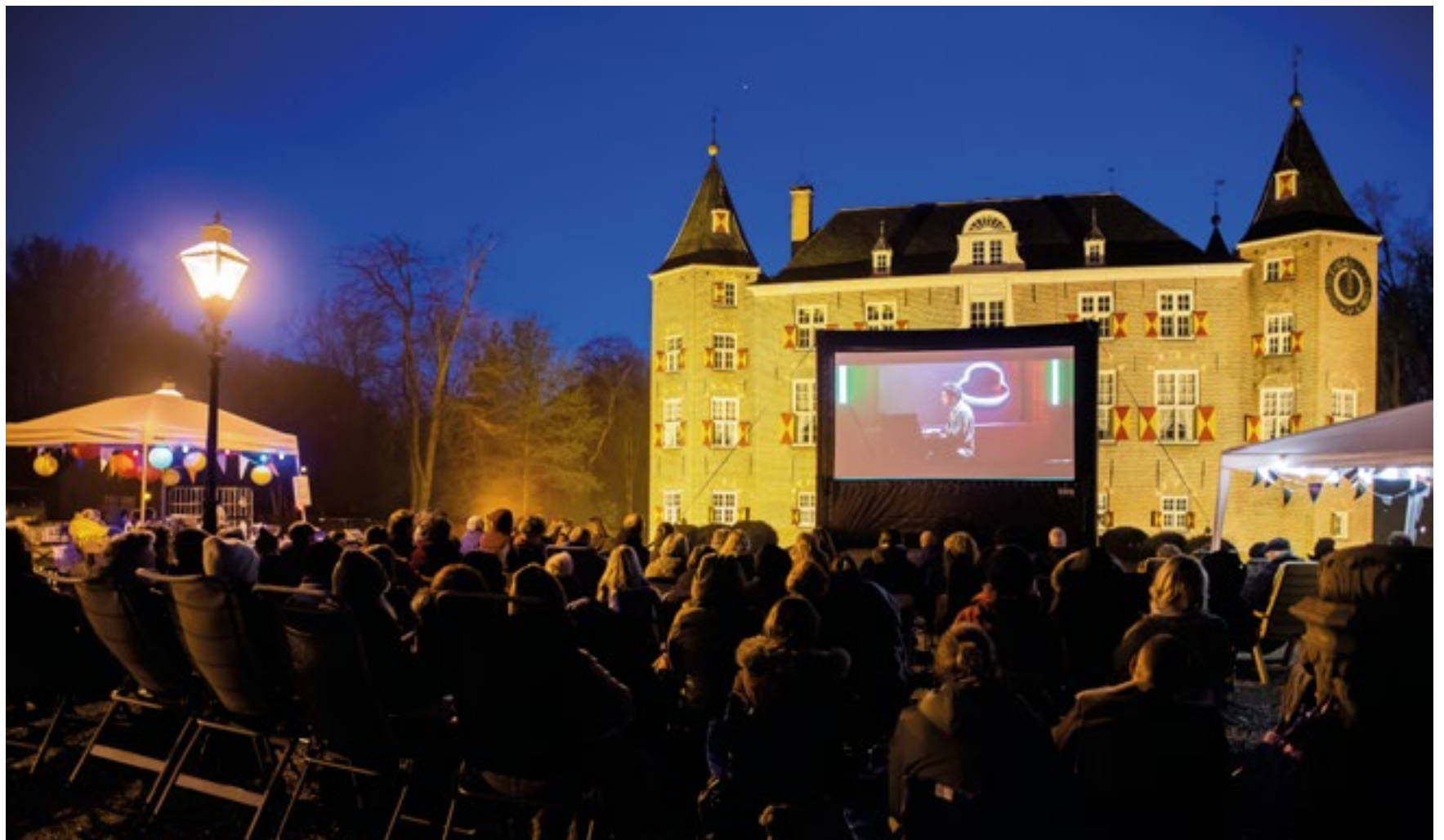
Meer dan 110 mensen bezochten zaterdagavond de openlucht bioscoop bij het kasteel Nederhorst georganiseerd door de Godardstichting