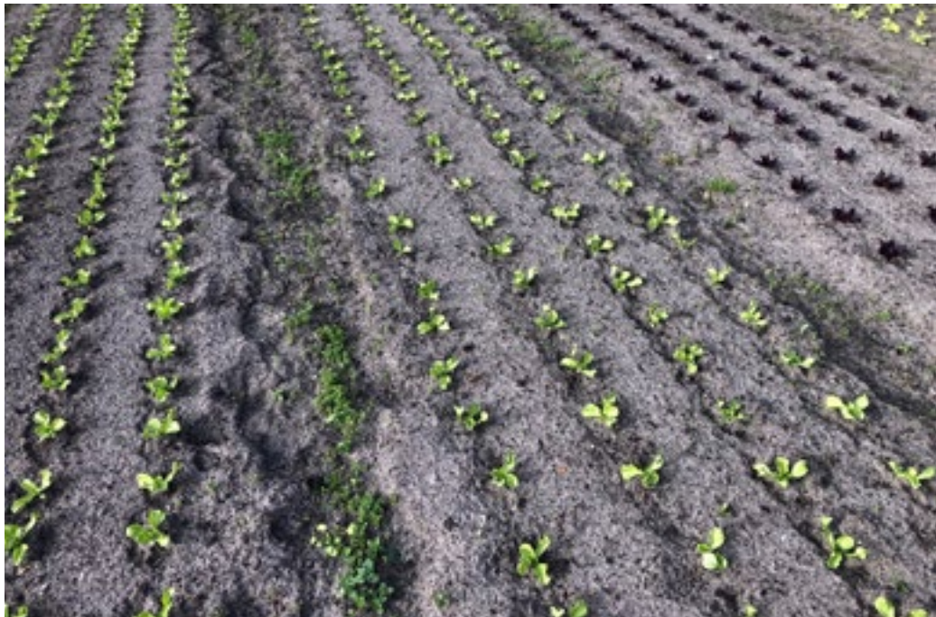
Foto: Kleumende sla en andijvie, ze staan er wel maar groeien, ho maar!