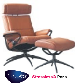
Stressless Stressless® Paris

Vanavond al zitten? Altijd meer dan 450 stoelen en banken op voorraad!