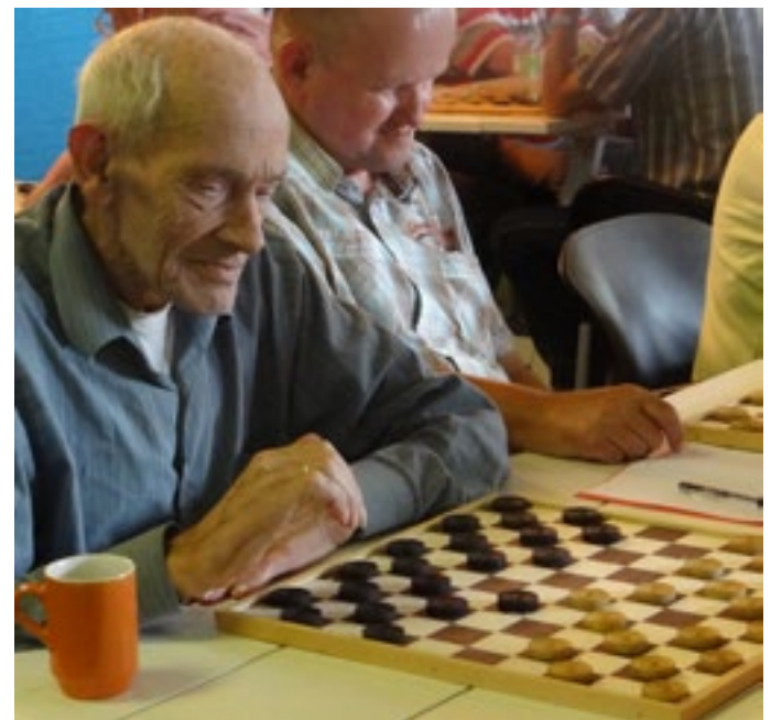
Foto: Archiefoto bekende oudere dammer

NEDERHORST DEN BERG In het kader van de zomeractiviteiten in de Bergplaats is er breaking news.