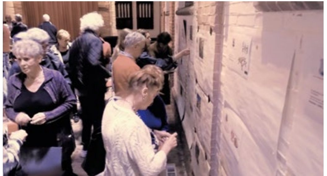
Foto: Kiezen uit de 14 projecten