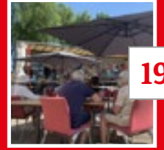
PASSIE VAN DE PASSIONADA'S