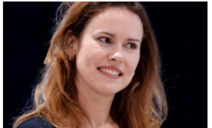
Archieffoto Esther Kaper (Douwe van Essen)

van onze inwoners een historische keuze moeten maken. Waarom kiezen we als ChristenUnie niet voor een van de andere opties? De ChristenUnie is niet voor torenhoge lasten en toch de dienstverlening niet op orde kunnen brengen. We zijn niet voor ingewikkelde samenwerkingsconstructies waarbij de politieke structuren alleen maar