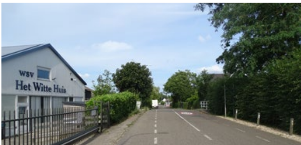
Foto: Wegwerk tot aan bruggetje Het Witte Huis