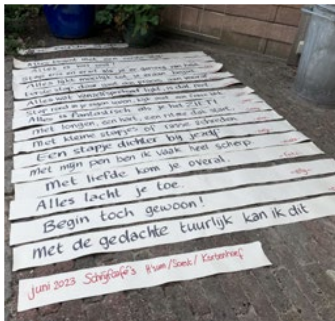
Foto: Een schuifgedicht

in het Schrijfcafé kunnen zich melden via de website www.zinexpres.nl of bellen met de schrijfcoach via 06-40155282.