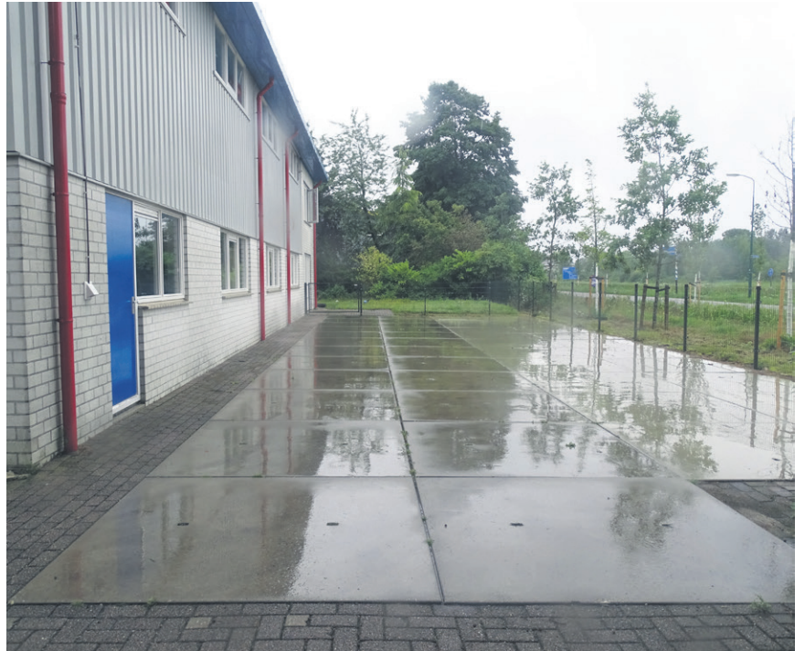
FOTO: Het parkeerterrein bij de burens dat wel kon