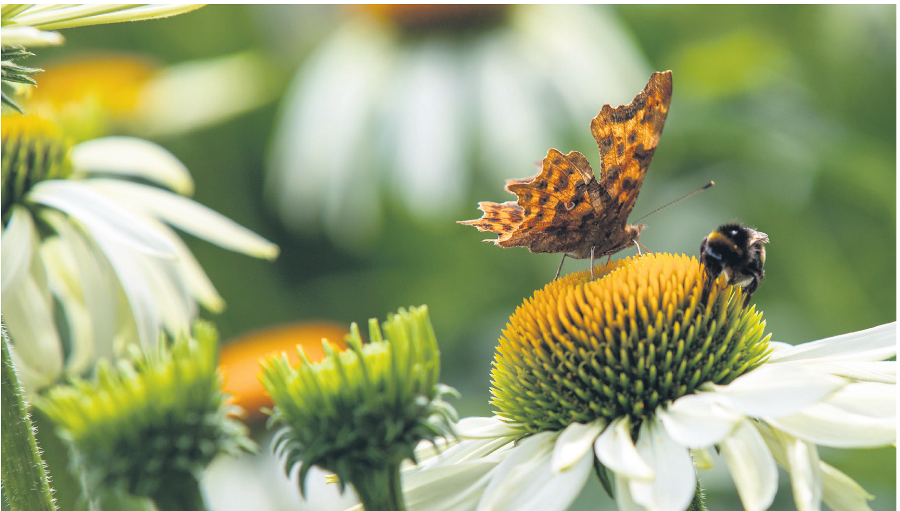
De geur van honing uit duizenden bloemen. Licht dansende vlinders en hommels die zoemen. Op mijn rug in het gras, zou ik willen dat altijd, altijd de wereld zo was (Marjolein Bastin)