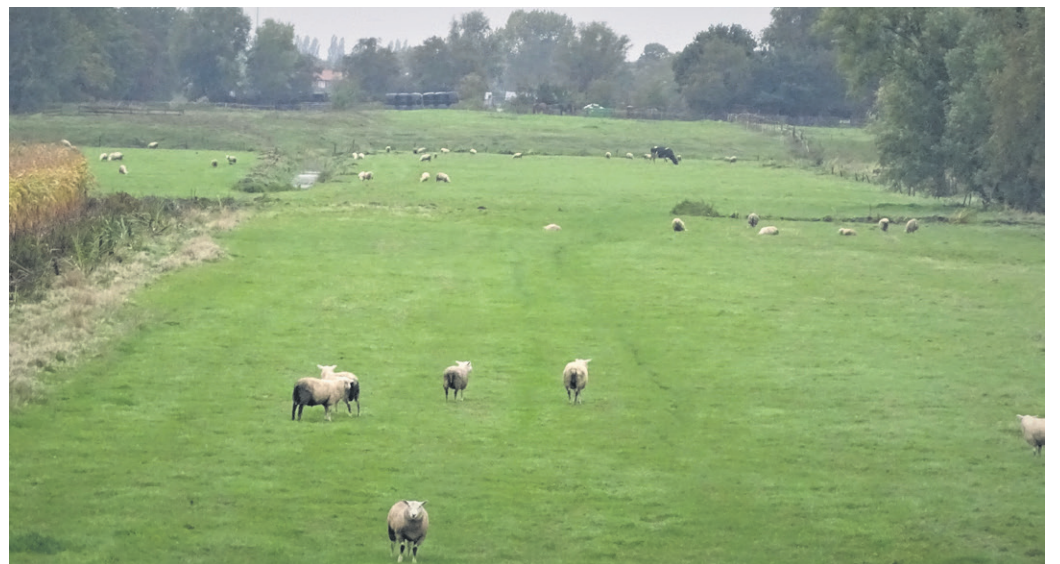
Foto: Zicht op de voormalige vuilnisbelt

In opdracht van de provincie Noord-Holland is er een ontwerpbesluit opgesteld. In dat besluit wordt melding gemaakt van ernstige bodemverontreiniging in de deklaag van