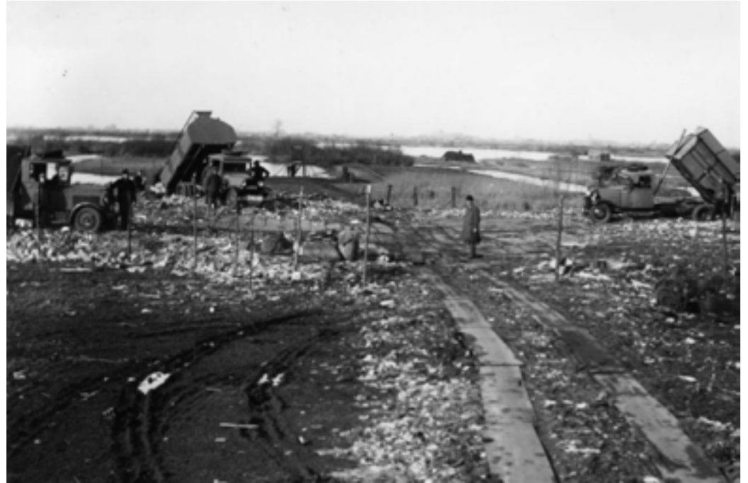
FOTO: Tientallen jaren werd er grof afval gestort