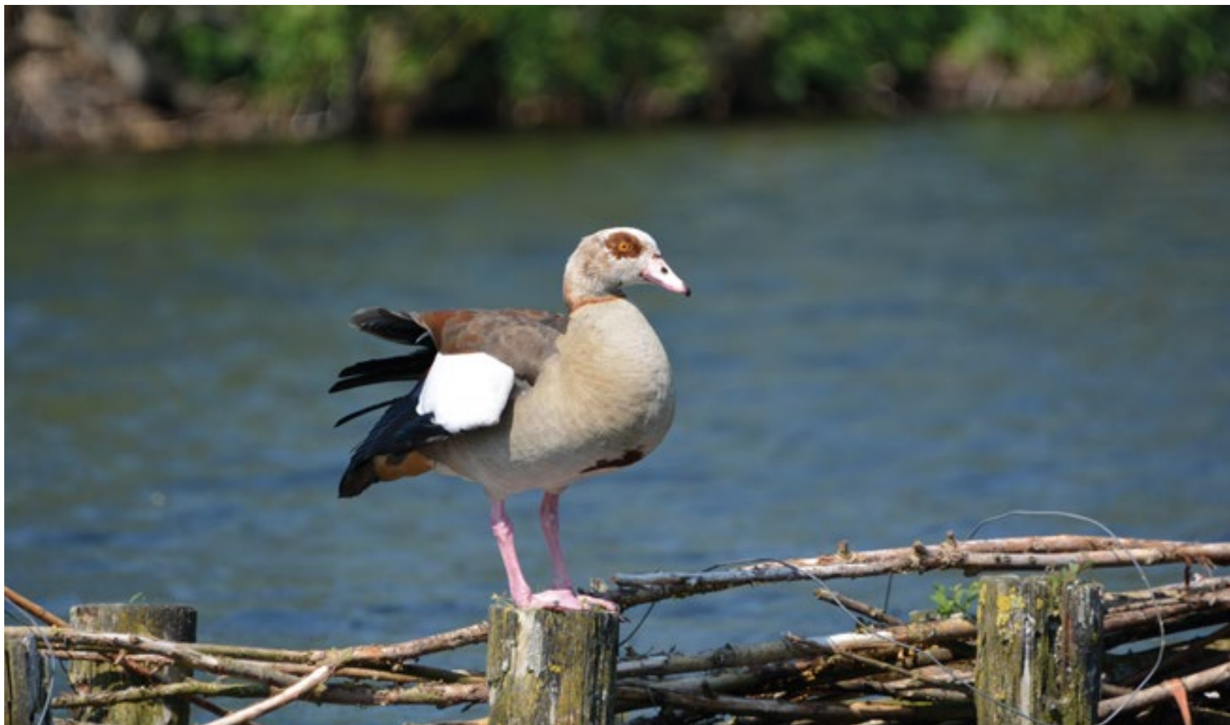
Een nijlgans op hoge poten en rode ogen / stond tussen de sloten op te drogen / want het is hier toch wel even wennen / zonder zandbak om je in droog te rennen / Guido van Geel (bij de Spiegelglas)