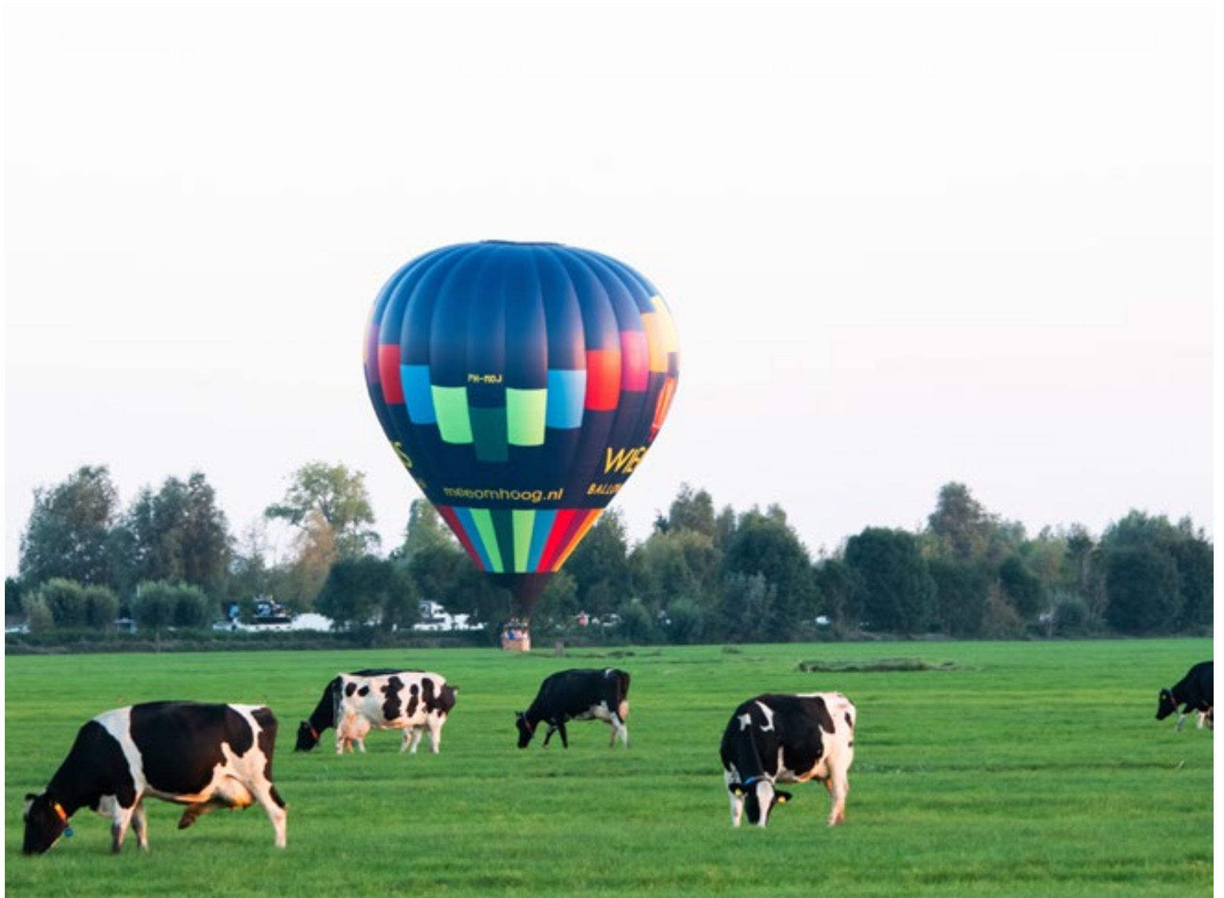
Tussen de bootjes in de Vecht en de koeien in het weiland vindt deze luchtballon nog wel een landingsplek.