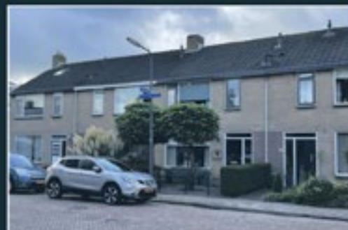
J.J. VAN GOYENSTRAAT 19 NEDERHORST DEN BERG 110 m 2 - € 475.000,- k.k.