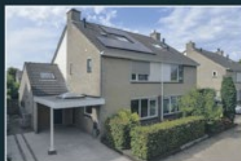
RIVIÈRAHOF 9 NEDERHORST DEN BERG 142 m 2 - € 645.000,- k.k.