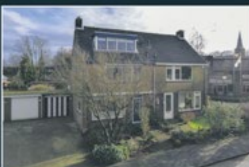
G.HENDRIK BREITNERLAAN 4 NEDERHORST DEN BERG