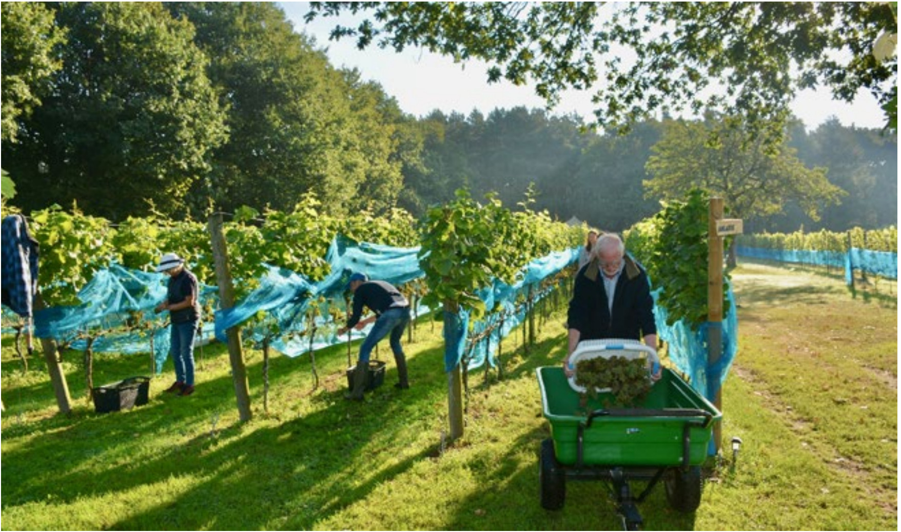
Vrijwilligers waren van de week druk met het plukken van de druiven, waar Wijngaard Zonnestraat weer mooie wijnen van kan maken.