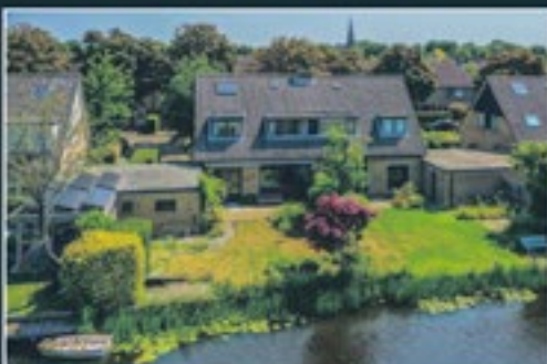
JOHANNES BOSBOOMLAAN 7 NEDERHORST DEN BERG 132 m 2 - € 685.000,- k.k.