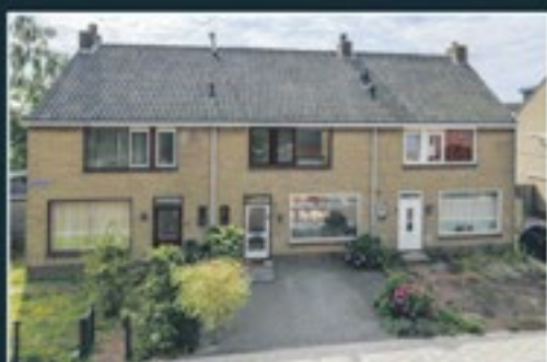
FAZANTELAAN 16 NEDERHORST DEN BERG