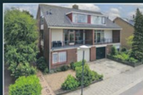
OVERMEERSEWEG 111 NEDERHORST DEN BERG 156 m 2 - € 695.000,- k.k.