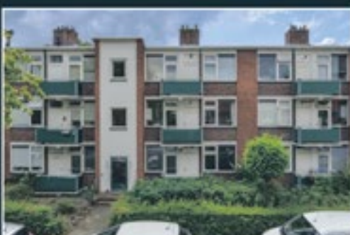
ANTHONIE FOKKERSTRAAT 76 BUSSUM 49 m 2 - € 255.000,- k.k.