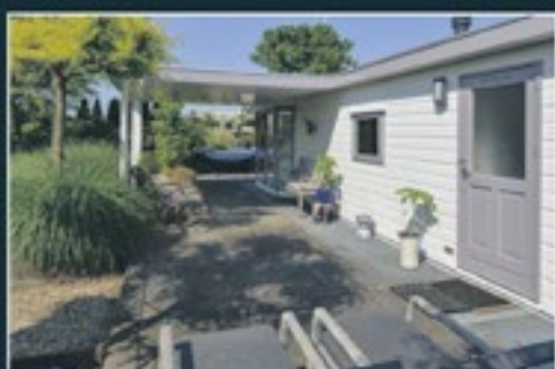
EILANDEWEG 32 - C 040 NEDERHORST DEN BERG