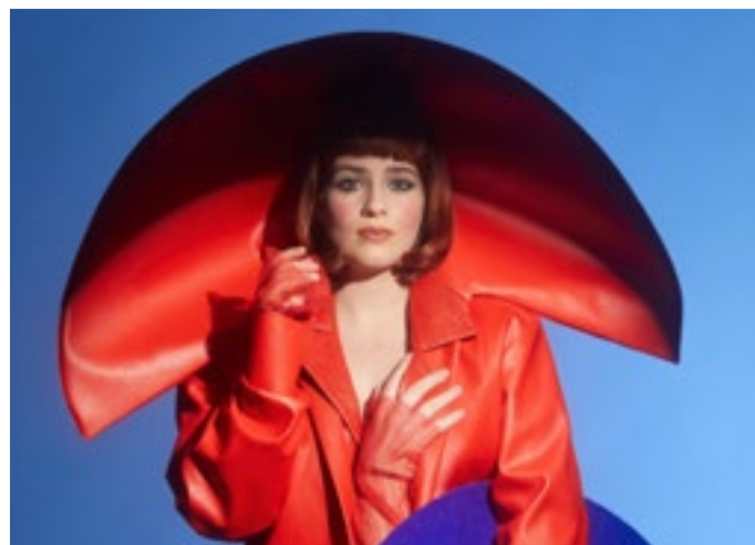
Foto: Cabaretière Valentina Tóth op 13 april 2024

Kaarten (€ 20): www.dedillewijn.nl ; 20.15 uur; Stichts End 57; 1244 PL Ankeveen.