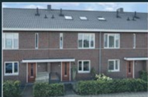
PLATANENLAAN 76 NEDERHORST DEN BERG 127 m 2 - € 575.000,- k.k.

KOM NAAR DE NVM OPEN HUIZEN DAG OP ZATERDAG 30 SEPTEMBER