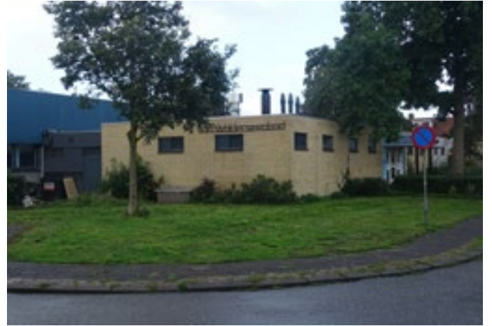
Foto: Het plein rond het Van Walderveenbad

Sinds 2021 is er al met de buurtbewoners en belanghebbers gesproken over hun wensen en ideeën voor de nieuwe inrichting van de Prinsessenbuurt. Hier is zo veel mogelijk geprobeerd rekening mee te houden in het definitieve ontwerp. Zo wordt de hele wijk een 30 kilometergebied