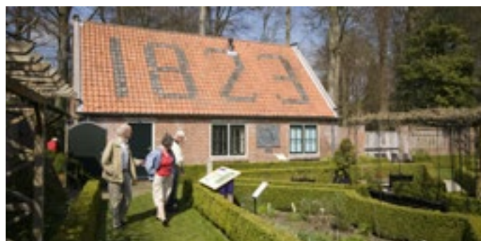
Foto: Siertuin 1823

Zaterdag 9 september van 13.00 tot 17.00 u. zijn de Siertuin en Gnoestallen geopend; Inschrijven voor de rondleidingen: natuurmonumenten.nl/openmonumentendag; Adres Gooilust: Zuidereinde 47B, 1243 KL, 's-Graveland; Kom indien mogelijk met de fiets, de parkeerplaats is zeer beperkt (parkeren kan alleen aan de linkerkant van de oprijlaan van Gooilust); De Siertuin en Gnoestallen zijn niet goed toegankelijk voor mensen die slecht ter been zijn (de paden zijn onverhard); Honden mogen niet mee.