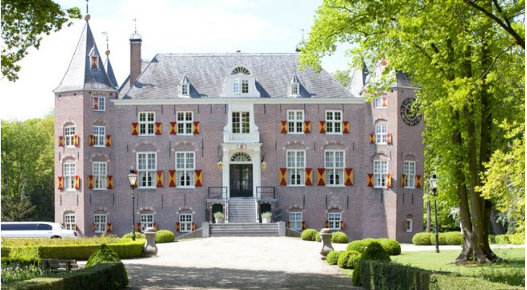
Open Monumentendag op 9 september, bezoek ons mooie kasteel Nederhorst.