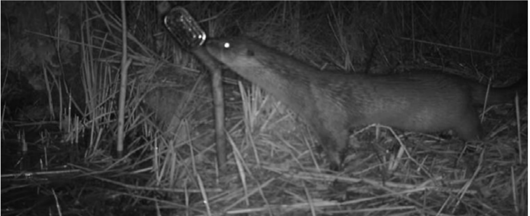
Foto: Otter op de wildcamera