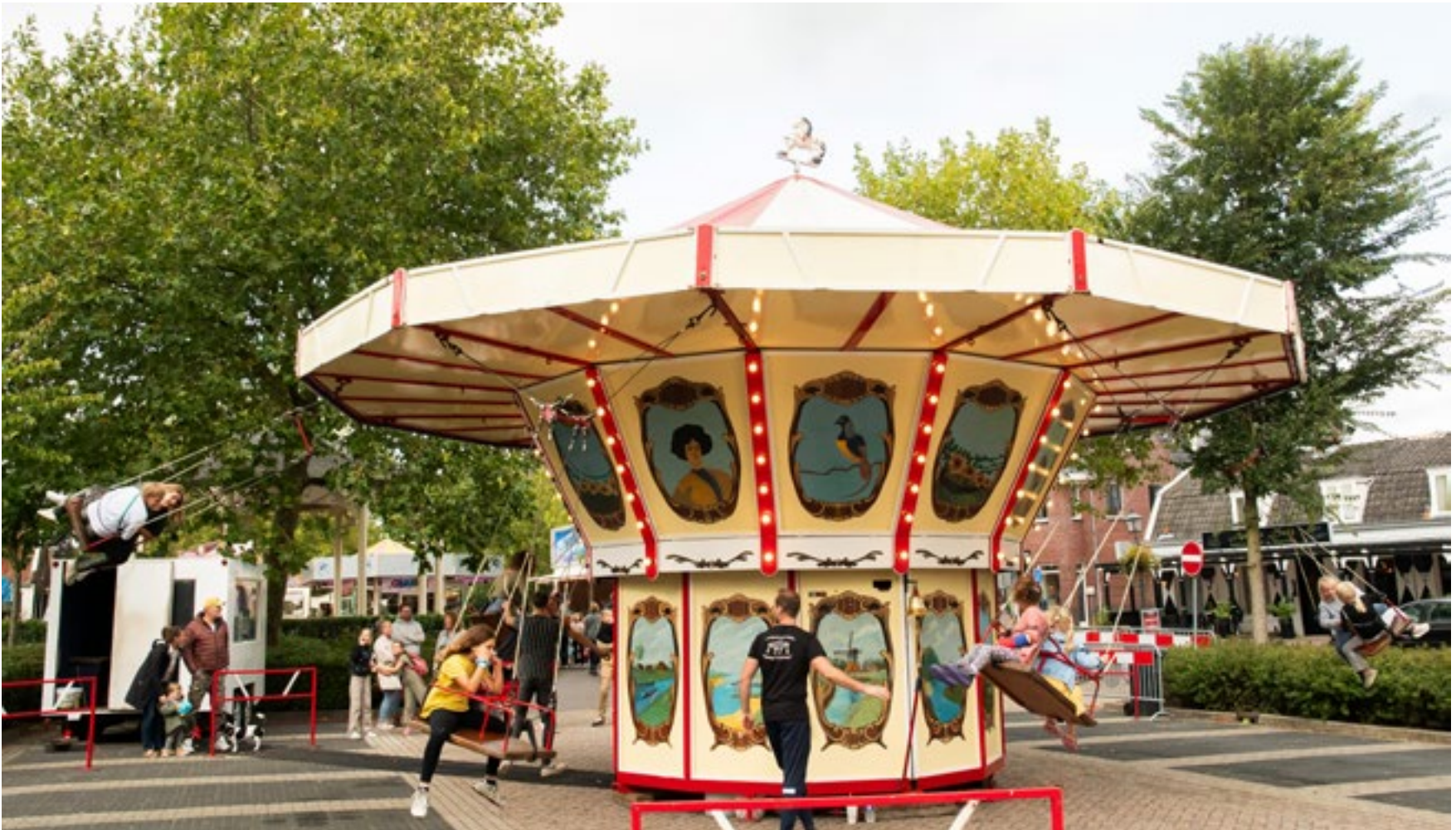
Op de laatste mooie zomerse dagen toch nog een kermis in Nederhorst, waar je nog gezellig van de zweefmolen kan genieten.