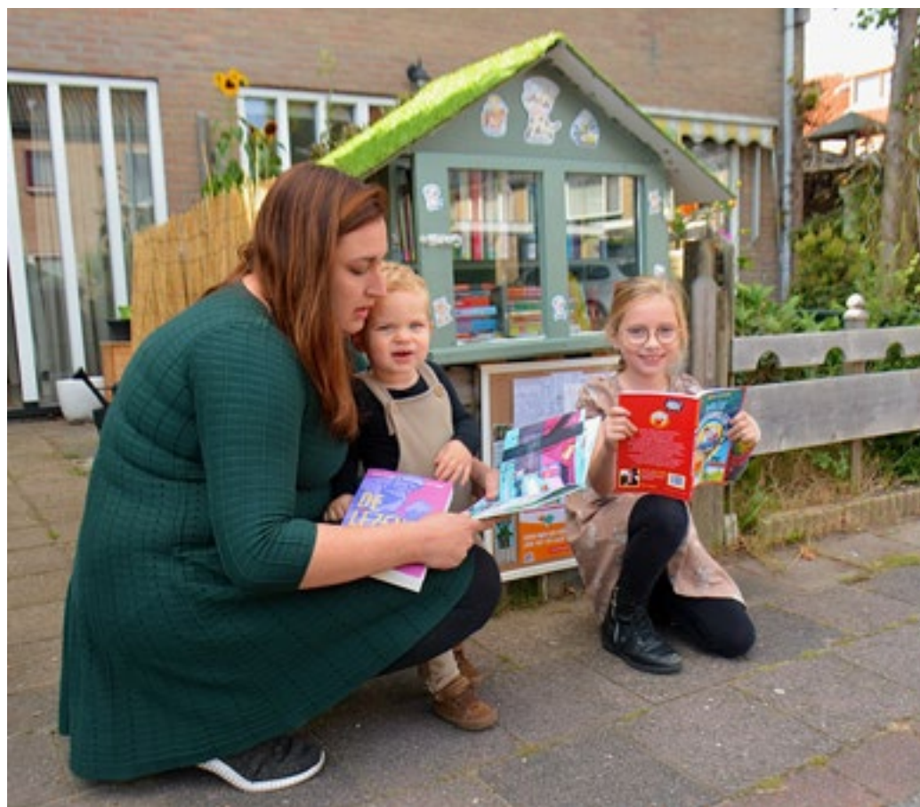
Deze week Kinderboekenweek, maar in de 'kinderminibieb' in de Van Dorenwerdestraat 4 in Loosdrecht kun je altijd terecht voor een mooi kinderboek!