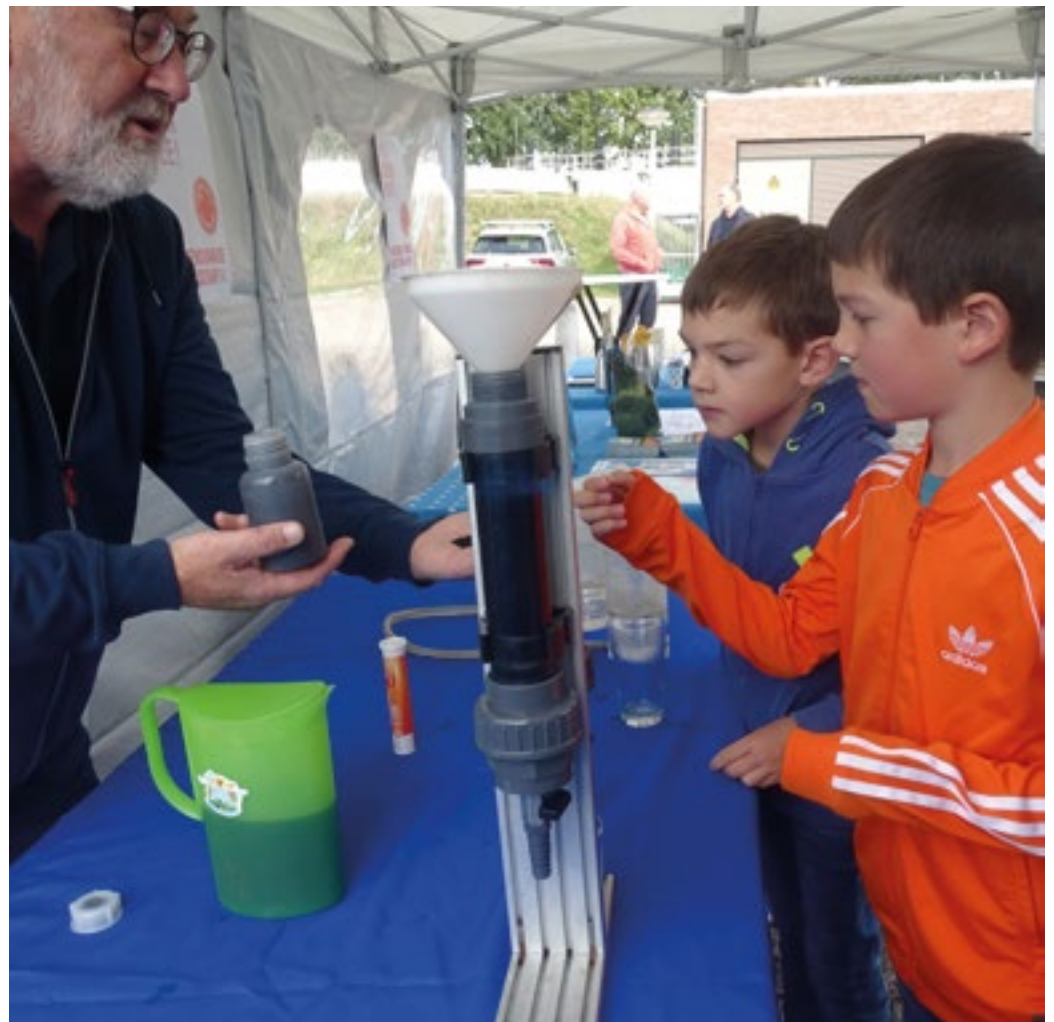
Foto: Deze jongens deden proefjes met water zuiveren

Op de RWZI wordt nu de allernieuwste innovatie gebouwd die na twee jaar voorbereiding eind januari 2024 zal worden voltooid. Twee grote kelders van 16 bij 3 meter water waar ozongas doorheen wordt gespoten. Direct daarna komt de aftakking naar de actieve koolfilters. De combinatie ozon-koolfilter zorgt ervoor dat ook medicijnresten grotendeels worden verwijderd, zodat we geen waterkreeften meer aantreffen met antidepressiva in hun lijfjes. Alle gangen en bakken die een ingewikkeld biologisch proces ondergaan, leveren uiteindelijk schoon water op. Volgens Europese