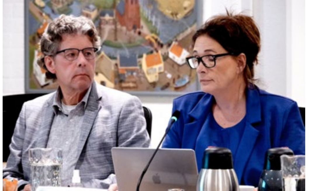
Een verdeelde DB-fractie