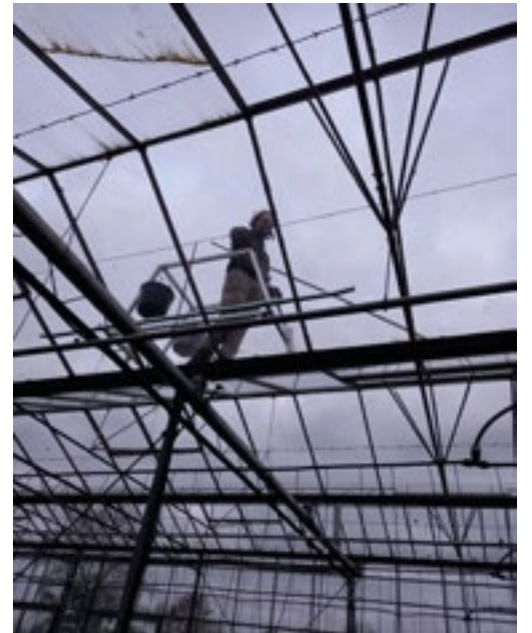
Foto: Met de gootrollator

Maar ook in de herfst blijft er kwekerswerk te doen: We snoeien planten die alweer in de pot staan voor volgend jaar en we halen alle bloemen uit onze geraniums omdat we die dit jaar niet meer gaan verkopen. Voor de nieuwe deelnemers is dat even wennen, wie haalt er nou mooie bloemen uit de planten?? Regelma-