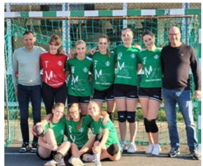
Foto: ASV B-jeugd in nieuwe outfit met 2 sponsors

Ons buitenseizoen liep tot 8 oktober en de trainingen waren op het ASV-terrein in Ankeveen. Vanaf 15 oktober zullen we starten in de zaal in sporthal De Fuik/ Weesper-sluis.