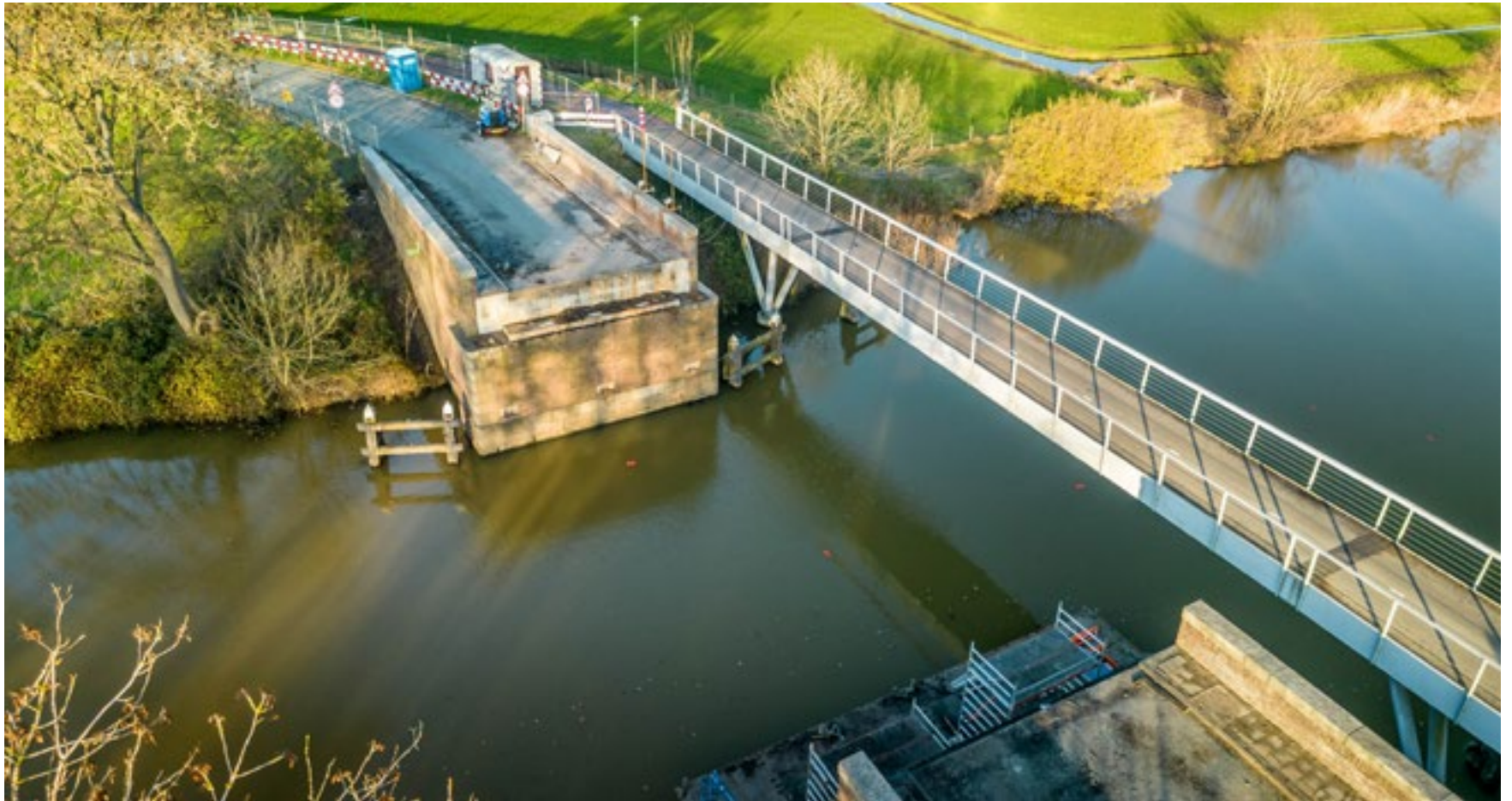
Niet meer met de auto over de eerste Kanaalbrug. Alleen nog met de fiets of brommer tussen 's-Graveland en Loosdrecht / Hilversum