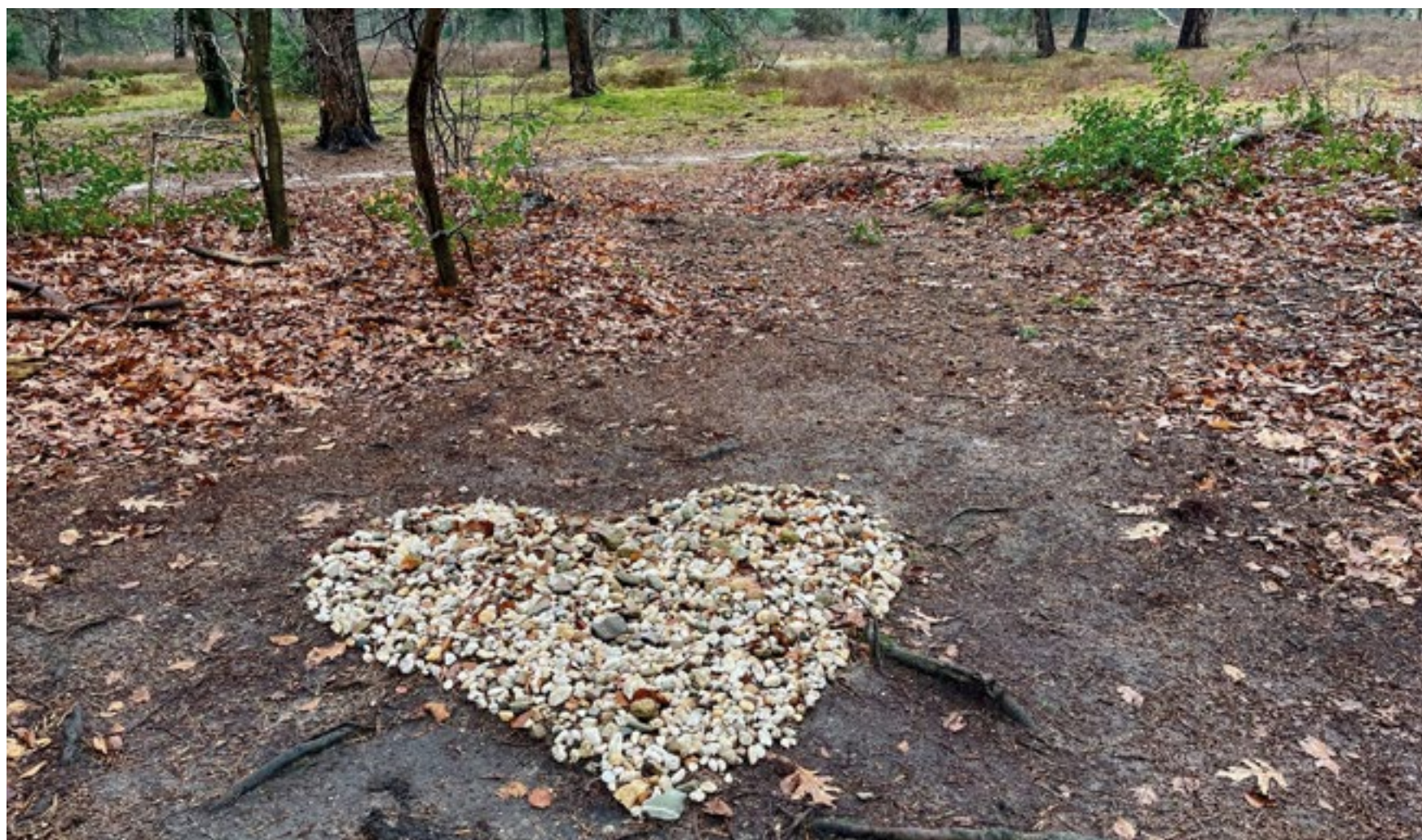
Ach natuurlijk, 14 februari, Valentijnsdag!