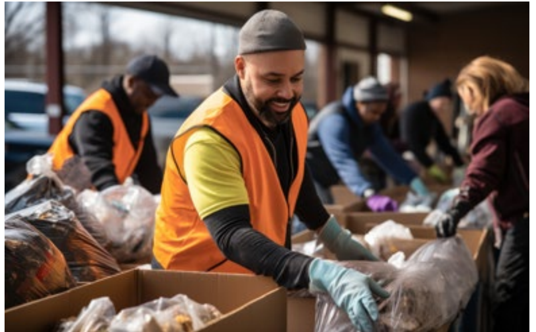
Foto: Er is geen Voedselbank in Wijdmeren

De gemeente heeft 12 regelingen waarop gezinnen met een minimuminkomen een beroep op kunnen doen. Daarvan zijn 4 regelingen specifiek bedoeld om kinderen aan maatschappelijke activiteiten te kunnen laten deelnemen. Deze zijn al meer dan 5 jaar oud, de bedragen zijn daarna niet meer bijgesteld. Een voorbeeld: gemiddeld ontvangen huishoudens € 1.000 bijzondere bijstand in Nederland. In Wijdmeren is dit € 326. Volgens de gemeente hebben 263 huis-