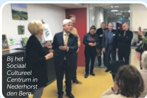
Bij het Sociaal Cultureel Centrum in Nederhorst den Berg