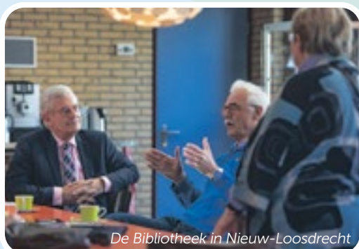
De Bibliotheek in Nieuw-Loosdrecht