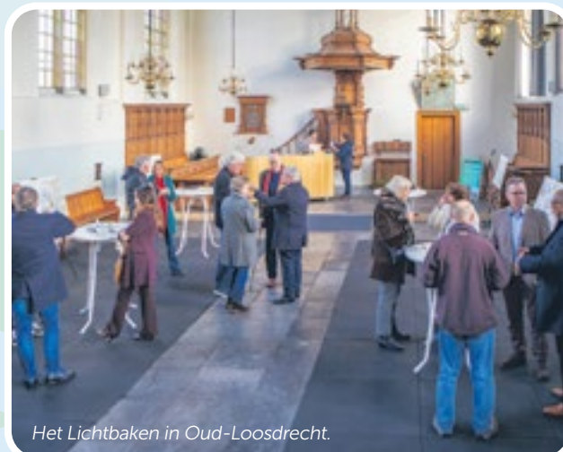
Het Lichtbaken in Oud-Loosdrecht.