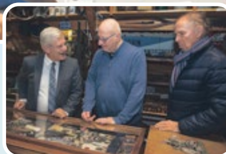
In gesprek bij de Historische Kring 'In de Gloriosa' Ankeveen-s-Graveland-Kortenhoef