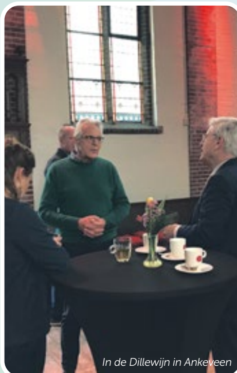
In de Dillewijn in Ankeveen