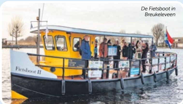
De Fietsboot in Breukeleveen